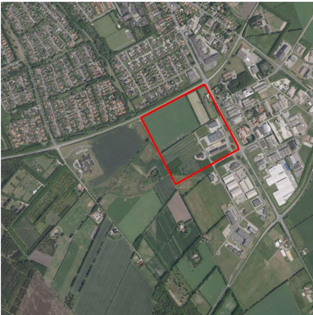
Kommuneplantillæggets afgrænsning er vist med den røde linje

Det udpegede område, der ligger ved Jeppe Skovgaards Vej i Varde Syd, udgør et areal på ca. 20 ha. og omfatter matrikel nr. 16c, 18ab, 18k, 18m, 18x, 18y, 18z, 18æ, 18ø og 28y Varde Markjorder samt en del af matrikel nr. 18c og 7000hu Varde Markjorder.